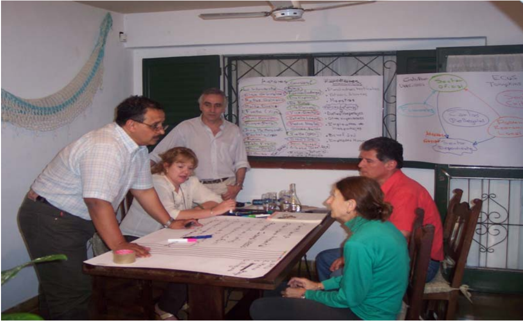
Parte del equipo de trabajo