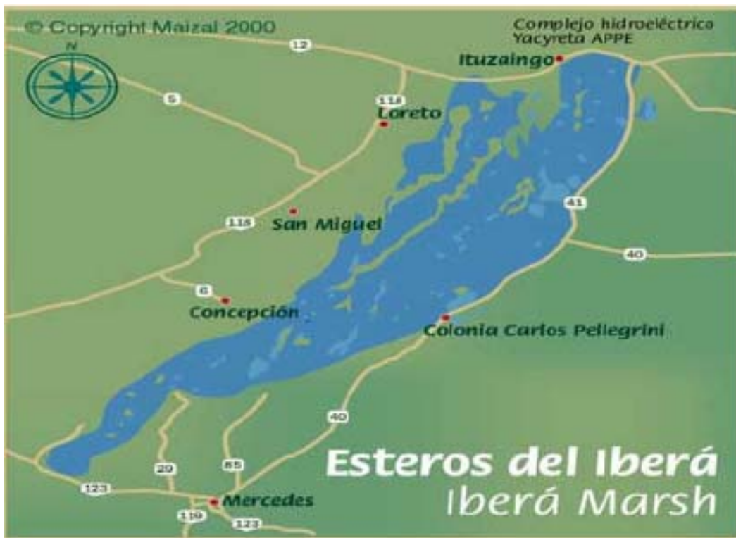
Ubicación de la Colonia Carlos Pellegrini